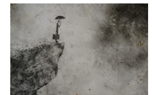
En couverture Fragment du Syndrome Mary Poppins Peinture par Antoine JOSSE 30 x30 (2012)